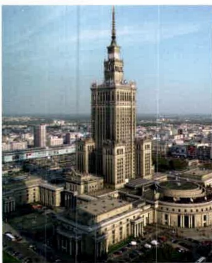
Pałac Kultury i Nauki