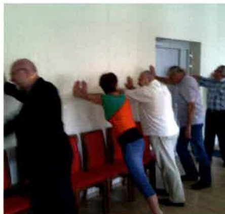
Uczestnicy Forum Dialogu - jeden ze sposobów radzenia sobie ze stresem