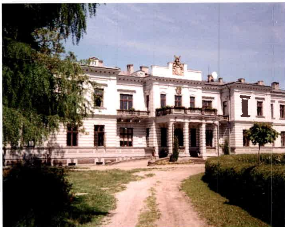
Pałac w Szymanowie

Na zachodnim Mazowszu zwiedzić kilka rezydencji wyjątkowych w skali kraju takich jak te w: Miedniewicach, Guzowie, Szymanowie czy Teresinie. Potem jeszcze koncert muzyki