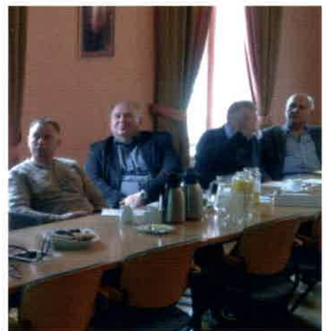
Forum Dialogu w Województwie Pomorskim

zbiorowych nie wystarcza, by profesjonalnie przeprowadzić cały proces od zgłoszenia sporu zbiorowego poprzez rozkowania, mediacje, do strajku łącznie i równocześnie nie narazić związku, protestują-