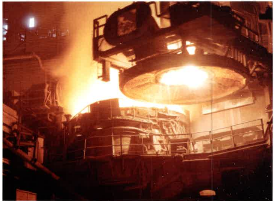
Huta w Ostrowcu Świętokrzyskim (fot. A. Matysek)

walny jest wzrost wielkości dostaw tego rodzaju wyrobów, co znacząco wpływa na średnią cenę rynkową stali i jest poważnym zagrożeniem dla tego sektora w Polsce.