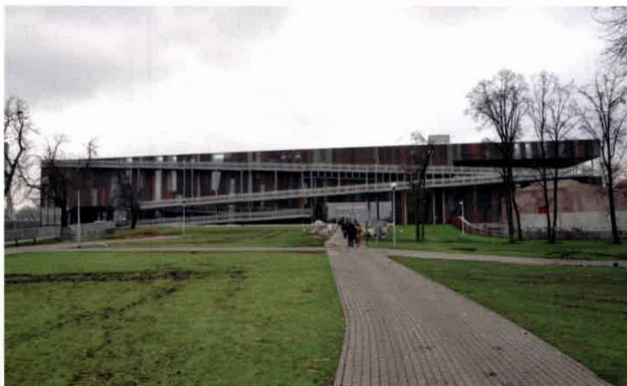
Centrum Nauki Kopernik w Warszawie

W okolicach Warszawy, pod Radzyminem w 1920 r., w czasie wojny polsko-bolszewickiej, rozegrała się zwycięska bitwa