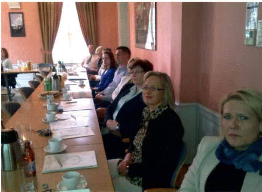
Uczestnicy Forum Dialogu w Województwie Pomorskim

lub strajkujących na stwierdzenie: „niezgodne z prawem” lub „strajk nielegalny”.