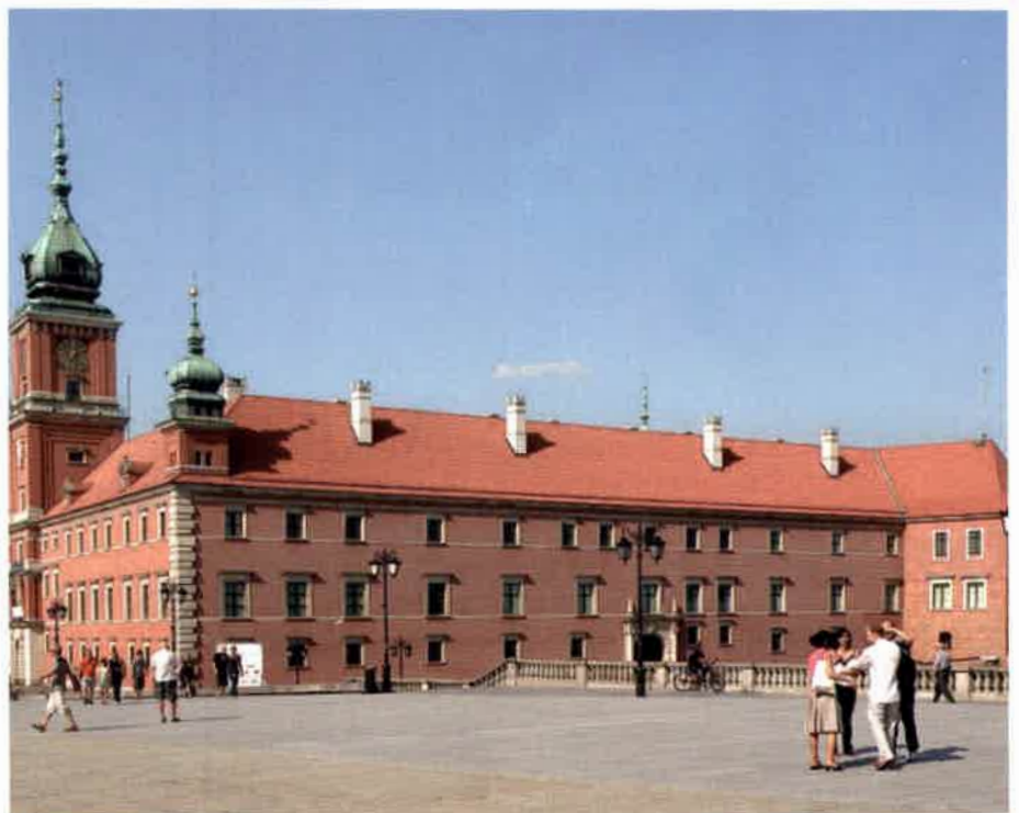
Zamek Królewski w Warszawie