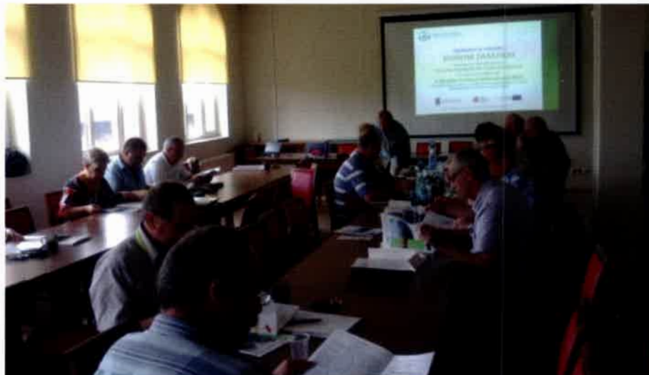
Forum Dialogu Województwa Dolnośląskiego