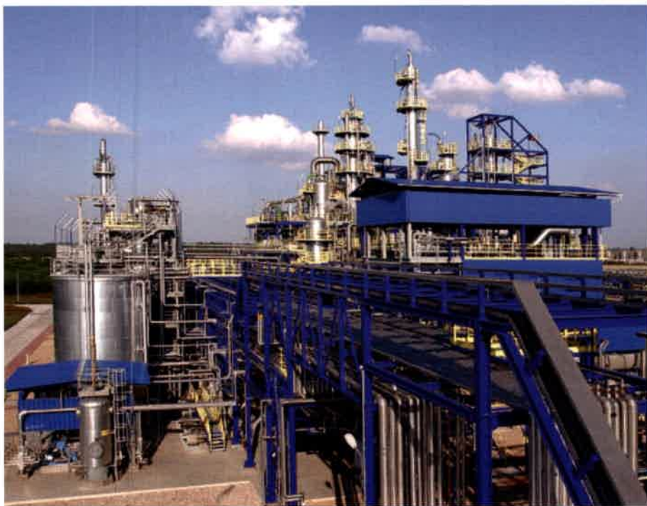
Instalacje produkcyjne w Zakładach Azotowych "PUŁAWY" S.A.

określili to nawet próbą „wrogię przejęcia”. Jednak Rosjanom – w przypadku tarnowskich ZA – udało się skupić jedynie 11 proc. akcji za-