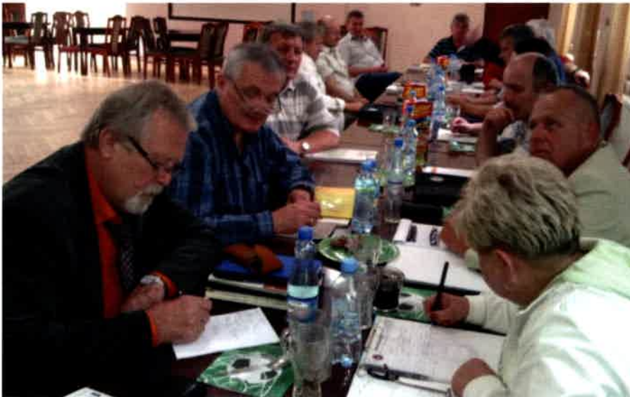
Cafe Forum w Przesiece

W innych miastach pracownicy komunikacji miejskiej nie mieli tyle szczęścia. Opisywana w biuletynie sytuacja komunikacji miejskiej w Wałbrzychu nadal czeka na sensowne rozwiązanie. Konieczność zapewnienia mieszkańcom miasta publicznego transportu zbiorowego powoduje, że stosowane są zastępcze, doraźne rozwiązania. Jednym z nich jest zatrudnienie części kierowców z upadłego Miejskiego Przedsiębiorstwa Komunikacyjnego na umowy czasowe. Umowy zapewniają prace kierowcom tylko do końca roku, ale wynagrodzenie, jakie teraz otrzymują za pracę są średnio niższe o 200-300 zł. Wałbrzyski Zarząd Dróg, Komunikacji i Utrzymania Miasta próbuje stworzyć plan