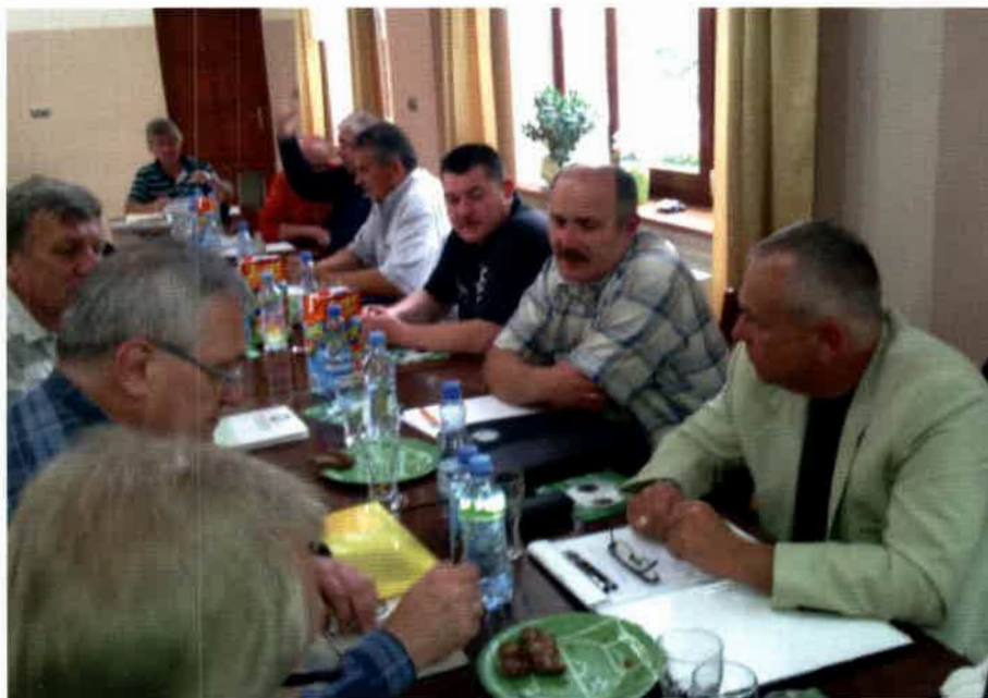
Uczestnicy Cafe Forum w Przesiece

Nie bez znaczenia dla ich warunków pracy mają wprowadzane zmiany w ustawach o