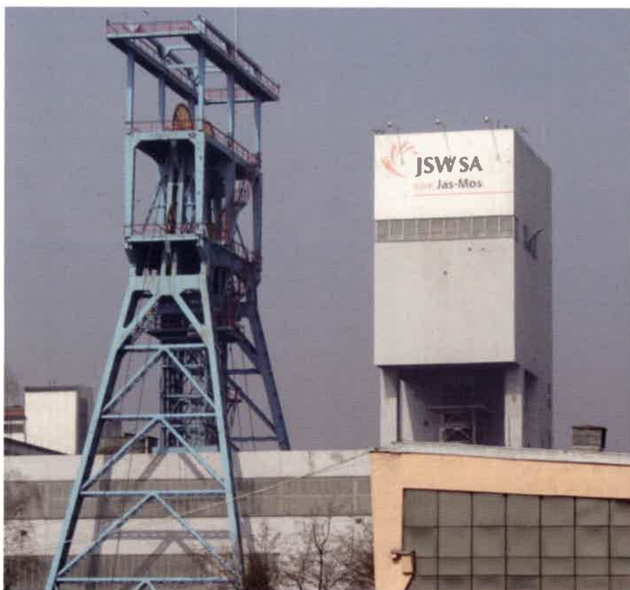
Jastrzębska Spółka Węglowa

Przypomnijmy, że powodem referendum strajkowego było fiasko rozmów w ramach dwóch sporów zbiorowych rozpoczętych w Jastrzębskiej Spółce Węglowej z początkiem 2012 r. Związkowcy walczą przede wszystkim o 7-proc. podwyżkę wynagrodzeń i zmianę zapisów nowych umów dla przyjmowanych górników, które jak twierdzą, są niezgodne z prze-