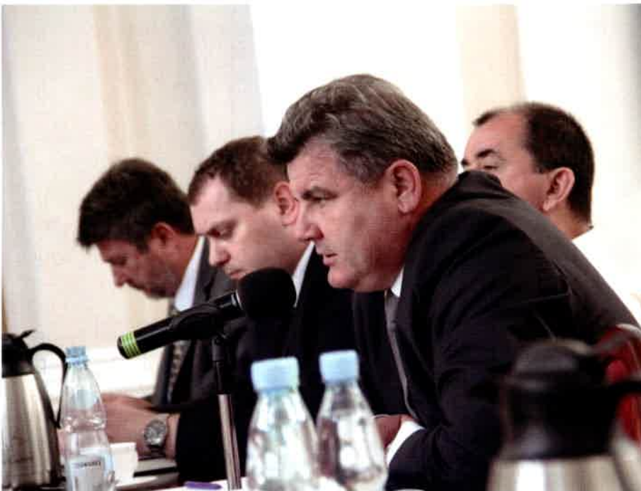
WKDS Województwa Podkarpackiego

Na dzień dzisiejszy, sytuacja w przewozach pasażerskich jest trudna. Przejazd z Przemyśla do Rzeszowa to ok. 3 godz., z Rzeszowa do Krakowa 3,5 godz. Po zakończeniu modernizacji tych linii, według zapewnień ministra, możliwe będzie skrócenie podróży z Rzeszowa do Krakowa nawet do jedenastej godziny. Minister zachęcał do inwestowania w poprawę infrastruktury