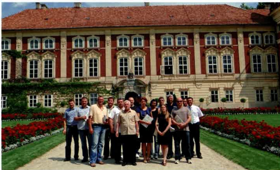
Uczestnicy Forum Dialogu w Łańcucie

Nie można powiedzieć, że policjanci zupełnie nie są wyposażeni w należne im do służby tradycyjne środki mogące zabezpieczyć ich zarażeniem tym groźnym wirusem. Tyle tylko, że środki te mogą być skuteczne przy założeniu, że osoba nie zachowuje się agresywnie i nie chce celowo kogoś zarazić. Jeśli tak, to te zabez-