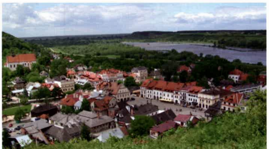
Kazimierz Dolny - widok z Góry Trzech Krzyży

wych. Stąd też szczególnie kontrola Straży Granicznej i Służby Celnej oraz strategiczne znaczenie takich miejsc jak Dorohusk, Hrebenne czy Hrubieszów. Lokalizacja nie zawsze ma jednak przełożenie na sytuację gospodarczą lokalnych społeczności, które już dawno przestały żyć z handlu wódką czy papierosami prze-