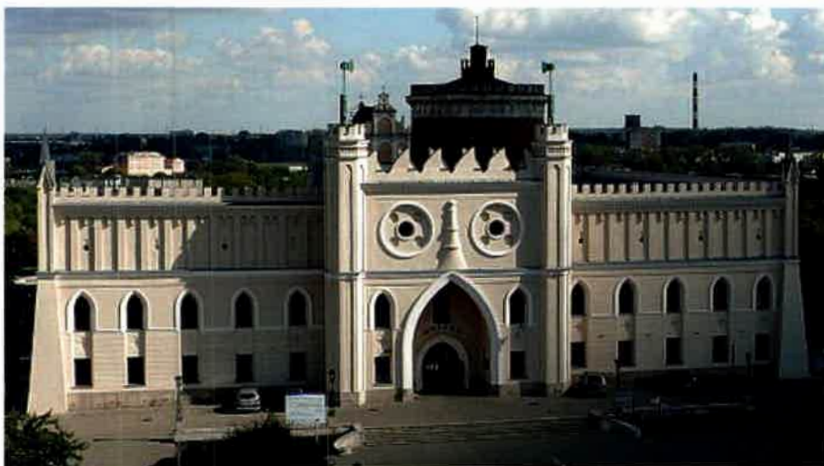
Zamek Królewski w Lublinie