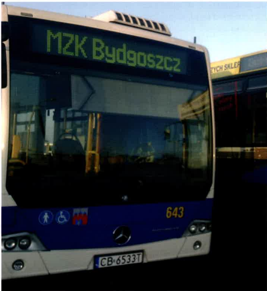
Jeden z pojazdów MZK Bydgoszcz

pełnienia funkcji Przewodniczącego ZW FZZ wiedziałem jednak, że nie pozostanę sam. Wybrani zastępcy oraz członkowie Prezydium to sprawdzeni i wytrawni działacze pełniący również najwyższe funkcje związkowe w swoich resortach. Gdyby nie ich pomoc, to na pewno nie podołałbym wszystkim sprawom zgłaszanym do Zarządu Woje-