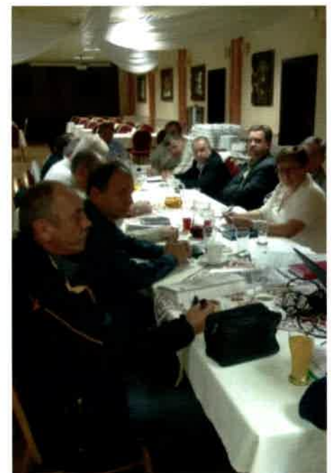
Spotkanie Cafe Forum

W dyskusji zabierali głos również pracownicy Zespołu Elektrowni „Dolna Odra”, a także Telekomunikacji (obecnie Orange), mający już doświadczenia związane z łączeniem zakładów pracy. U nich problem dojazdów na negocjacje został rozwiązany ko-