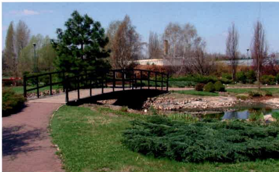
Ogród botaniczny PAN w Powsinie

Chopina w jego rodzinnej Żelazowej Woli, chwila zadumy w sanktuarium w Niepokalanowie, miejscu działalności świętego o. Maksymiliana Kolbego i można wracać do fabryk, sklepów i urzędów.