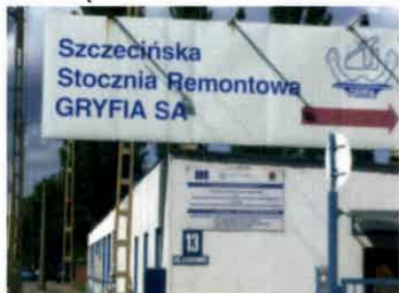
Wejście do Stoczni Gryfia S.A.

W strefie tej, jak podaje portal Gazeta.pl z 16 lipca 2012 r., znajdują się wszystkie tereny stoczni – 41 hektarów. Tylko 5,4 hektara będzie wykorzystywane pod produkcję stoczniową.