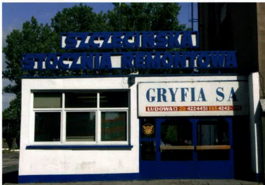
Szczecińska Stocznia Remontowa Gryfia S.A.

mówi, że najważniejsze jest zagwarantowanie dostępu do doku nr 5, bez którego nie można prowadzić remontów, a dok ten znajduje się na terenach, które zamierza wykupić ww. spółka. Poza tym związkowcy w ogóle mają wątpliwości, czy da się prowadzić działalność stoczniową na