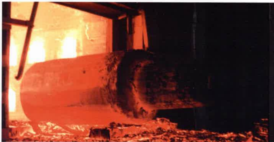
Wnętrze Huty CELSA

• straty Skarbu Państwa wynikają ze spadku wpływów do