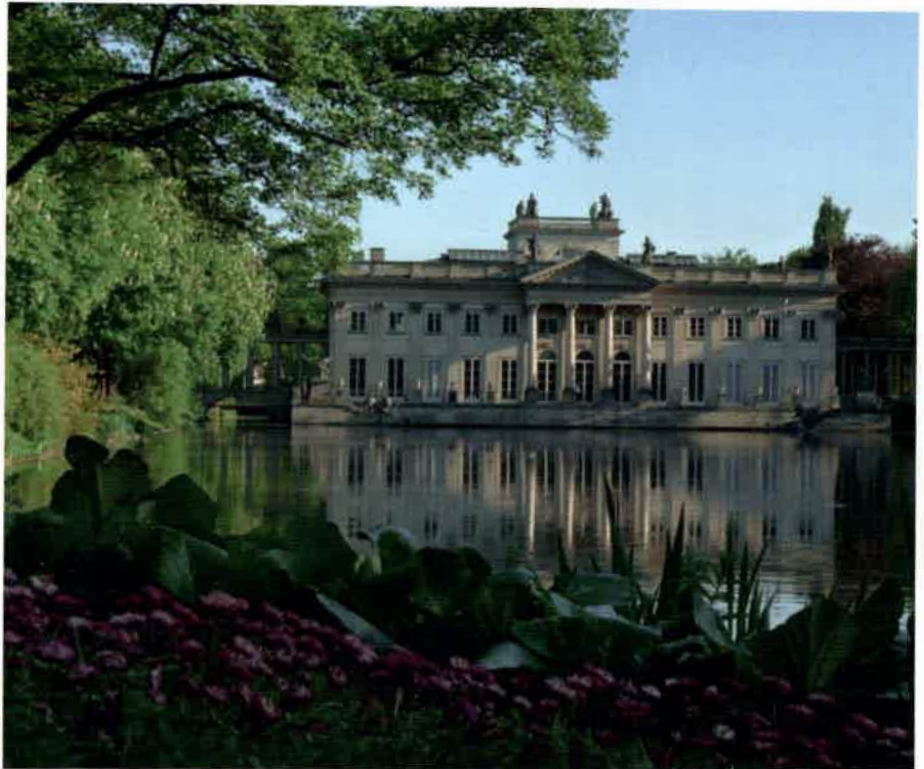
Łazienki Warszawskie - Pałac na Wodzie