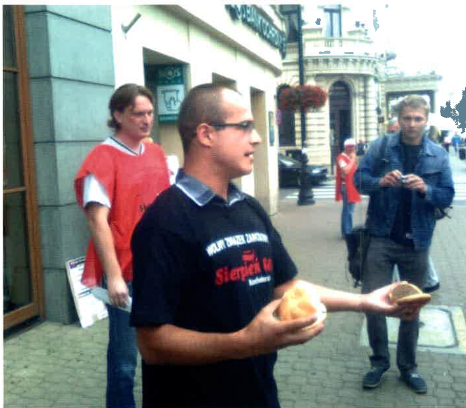
Akcja „Sierpnia 80” pod jedną z lubelskich restauracji McDonald`s

wych, na które bardzo często zatrudniają bogate koncerny, jak sieci handlowe, to troska o tych wszystkich uczciwych przedsiębiorców, którzy zatrudniają swoich pracowników na