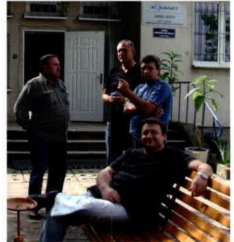
Uczestnicy pikniku