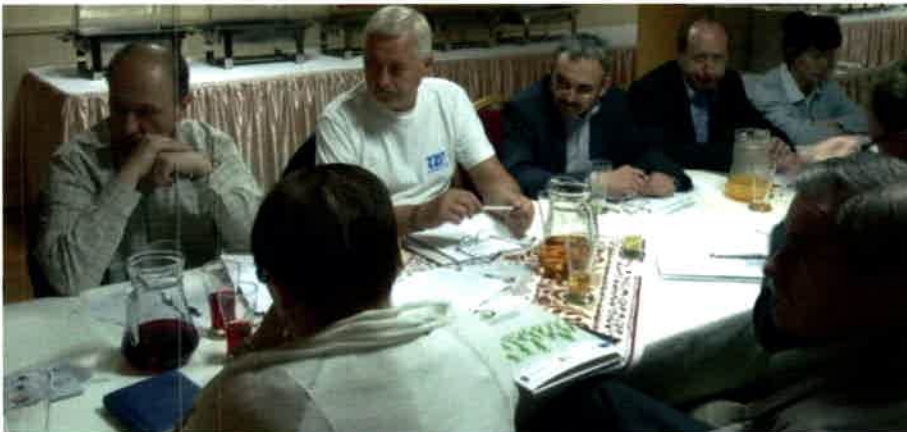
Cafe Forum w Policach

rzystnie, gdyż ich koszt pracodawca wzięł na siebie.