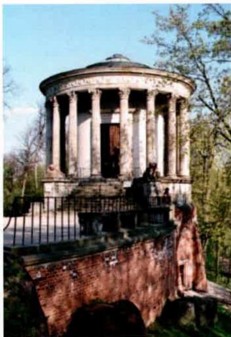
Świątynia Sybilli w Puławach