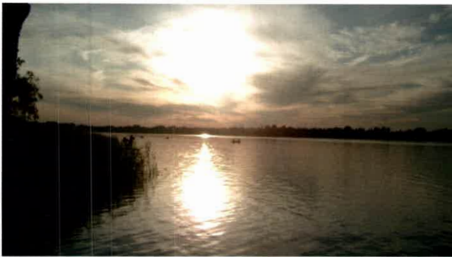
Zachód słońca nad Jeziorem Białym (Okuninka)

Znane na Lubelszczyźnie miejsca letniego wypoczynku to także zalew w Firleju czy Zemborzycki pod Lublinem. Amatorzy sportów zimowych znajdują tu wyciągi w Rąbłowie, Parchatce, Celejowie pod Kazimierzem Dolnym czy np. Jacni pod Zamościem.