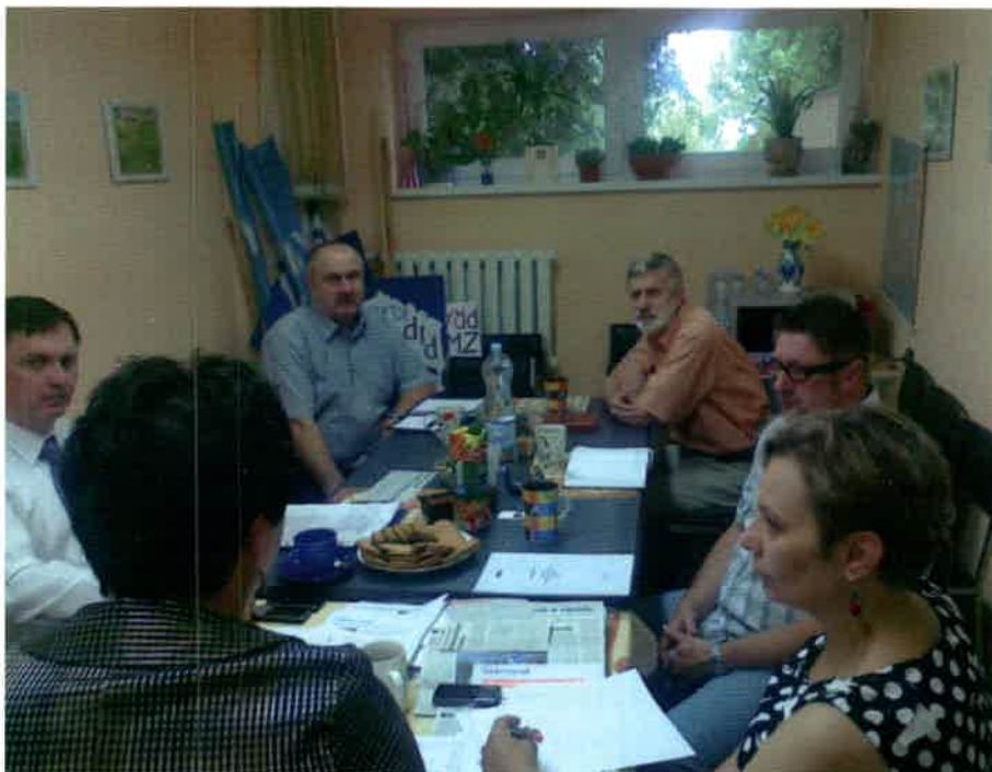
Uczestnicy posiedzenia ZP FZZ W Koninie

jącą w nim sytuację i nieustanną walkę związków zawodowych o miejsca pracy dla pielęgniarek i położnych oraz godziwe wynagrodzenia. Podczas posiedzenia głos zabrał przewodniczący Zarządu