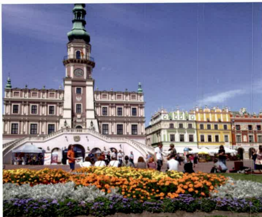
Zamojski magistrat

Są również mniejsze miejscowości, bogate w atrakcje turystyczne i towarzyskie, jak np. Kozłówka z zespołem pałacowo-parkowym i Muzeum im. Zamojskich oraz galerią socrealizmu. To właśnie tutaj kręcono część zdjęć do filmu dokumentalnego TVP Historia