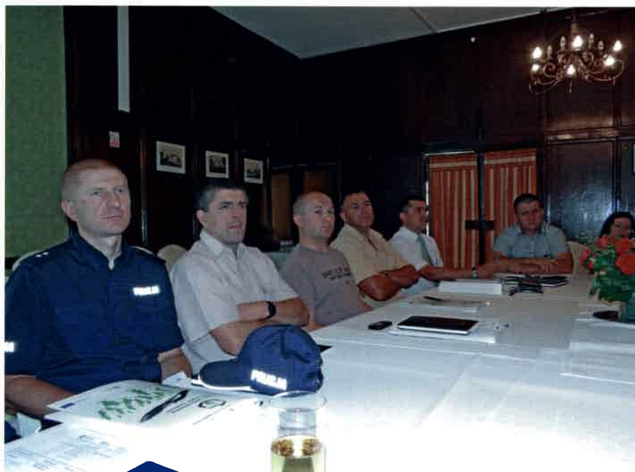
Forum Dialogu w Łańcucie

Dotychczas policjanci otrzymywali tylko pierwszą dawkę bezpłatnie. Pozostałą musieli kupić sobie sami. W zależności od składu dawki był to koszt 2-2,5 tys. miesięcznie. Pomogli koledzy poszkodowanego policjanta oraz Komendant Miejski zapomogą. Brak jest nadal systemowego rozwiązania, tj. zapisów w ustawie o Policji gwarantującego policjantom bezpłatną opiekę lekarską i leki oraz rehabilitację. Funkcjonujące obecnie rozwiązania nie gwarantują policjantom opieki